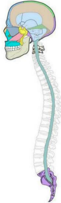
het cranio-sacrale systeem

Deze onderzoeks- en behandeltechniek richt zich op de schedelbotten (cranium) en inwendige vliezen die langs het ruggenmerg helemaal doorlopen tot in het heiligbeen (sacrum), de stroming van het hersenvocht en het hierin gelegen centrale zenuwstelsel (hersenen, hersenzenuwen en ruggenmerg). Anders dan dat wat lange tijd werd aangenomen is de schedel geen starre structuur maar een complex van schedelbotten (meer dan twintig) die door schedelnaden beweeglijk met elkaar verbonden zijn. Door het verloop van het harde hersenvlies (dura mater) en haar voortzetting helemaal tot beneden in het heiligbeen (os sacrum) is er ook een relatie in de bewegingsmogelijkheden tussen de schedel, de wervelkolom en het bekken.